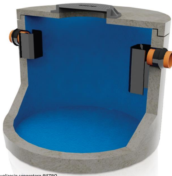
Wizualizacja separatora BISTRO